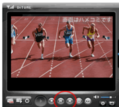
チャンネルダウン・チャンネルアップボタン

お好みのチャンネル名をダブルクリックする他、コントロールボタンの「チャンネルダウン」「チャンネルアップ」でもチャンネルを切り替えられます。